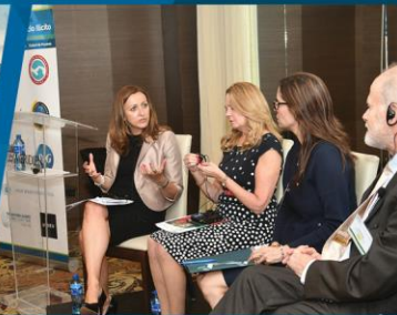
En el foro de 2018 en Ciudad de Panamá, los panelistas discuten "La amenaza del comercio ilícito dentro de las zonas de libre comercio".