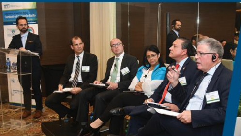
At the 2018 forum in Panama City, panelists discuss “Collaboration in the Fight Against Illicit Trade in Latin America”.

Thursday, October 18, 2018 >> Bogotá, Colombia