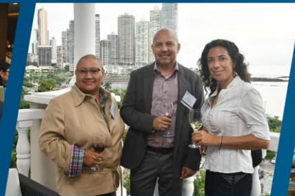
Los panelistas y los asistentes disfrutaron la recepción después del foro.