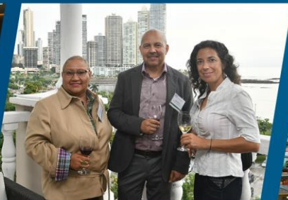
Panelists and attendees network and enjoy the reception following the forum.