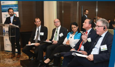
En el foro 2018 en Ciudad de Panamá, los panelistas discuten "La colaboración en la lucha contra el comercio ilícito en América Latina".

Jueves, 18 de octubre de 2018 >> Bogotá, Colombia